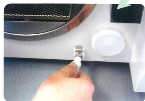
排水は付属のホースを差し込むだけの簡単操作