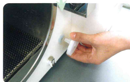
フィルター交換も前面からワンタッチで交換できる